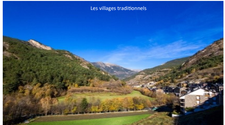
Les villages traditionnels

Petit déjeuner, départ en direction du PAS DE LA CASE pour faire votre shopping. Déjeuner libre. Départ après le déjeuner en direction de la FRANCE. Arrivée en fin de journée.